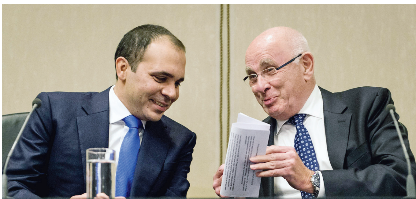
DAPAT SURAT KELANG: Dua kandidat Presiden FIFA Michael van Praag (kanan) dan Pangeran Ali bin Al Hussein saat memberikan keterangan di Amsterdam, Kamis (21/5). Keduanya mendapat 'surat kaleng' terkait pencalonan mereka sebagai Presiden FIFA.

Lepas dari soal itu, FIFA yang bermarks di Swiss itu tengah dihantam berbagai skandal, termasuk dugaan penyuaian keberhasilan Qatar menjadi tuan rumah Piala Dunia 2022. (AFP/AP/R-1)