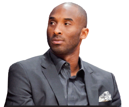
Kobe Bryan Pemain Los Angeles Lakers

Pemain berusia 36 tahun itu bermain untuk Lakers untuk seluruh kariernya di NBA, tetapi ia diganggu berbagai cedera dalam beberapa musim dan tidak mampu menampilkan permainan terbaik. Pada April 2013 Kobe menderita robek tendon achilles. Namun, Lakers tetap memperpanjang kontraknya dua tahun dengan nilai US$48,5 juta yang membuatnya menjadi pemain dengan gaji terbesar di NBA sekaligus membuat dirinya menjadi pemain pertama yang bermain untuk klub yang sama selama 20 tahun. (AFP/AP/Gnr/R-1)